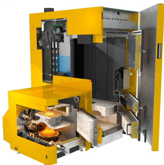
Combifire Chaudière à bûches-granulés 18-38 kW