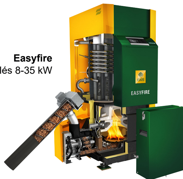
Easyfire Chaudière à granulés 8-35 kW