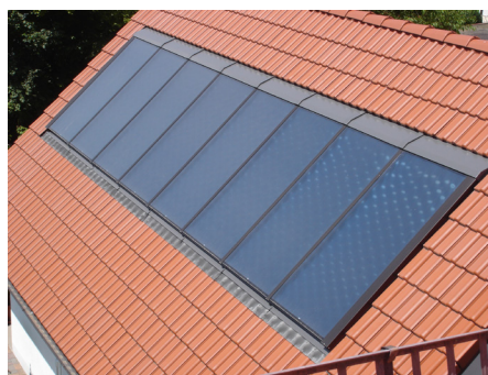
Citrin Solar CS 155 intégrés