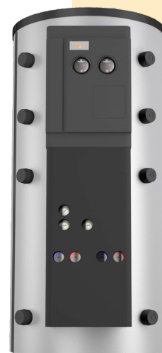
Accumulateur combiné Fresh

Energie Service Sàrl, Jurg Anken Route de Chavannes 26, 1464 Chêne-Pâquier info@energie-service.ch energie-service.ch +41 24 430 16 16